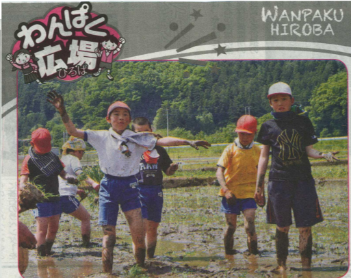
追加の苗ちょうだい! 陸前高田市横田町

31日からは「禁煙週間」 興大船運保健所で受動喫煙防止などについての取り組みを行っている。 6月6日(水)までの十分な知識の普及や各種取り組みを展開する。 5月31日は世界保健機関の決議に基づき、平成元年に定められた「禁煙デー」厚生労働省で、同4年、世界禁煙デーから始まる。